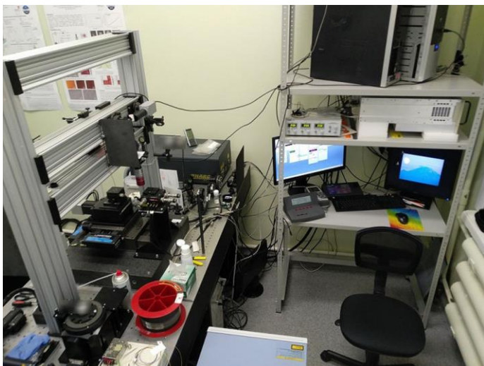
Рис. 1 Лабораторный макет установки по записи волоконных брэгговских решеток с помощью фемтосекундного лазера

Автоматизированная производственная установка (рис. 2) позволит создавать волоконные брэгговские решетки фемтосекундным излучением волоконного лазера в специализированных оптических волокнах без удаления защитного покрытия с производительностью не менее 10 шт. в час, для ВБР-датчиков и ВБР-фильтров.