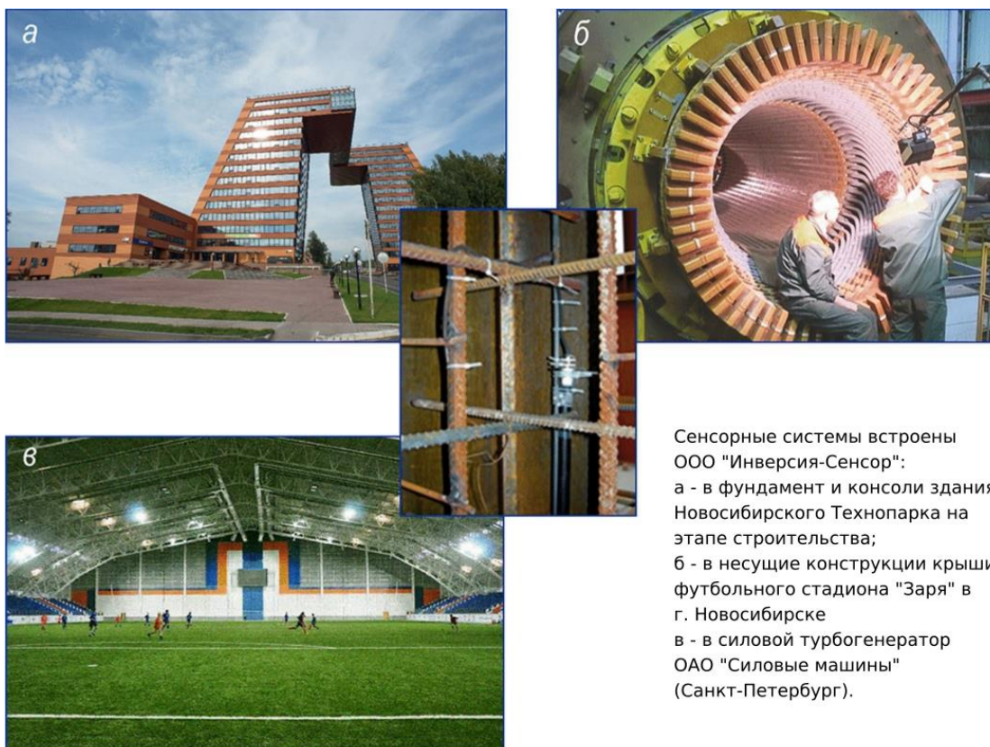
Сенсорные системы встроены ООО "Инверсия-Сенсор": а - в фундамент и консоли здания Новосибирского Технопарка на этапе строительства; б - в несущие конструкции крыши футбольного стадиона "Заря" в г. Новосибирске в - в силовой турбогенератор ОАО "Силовые машины" (Санкт-Петербург).

Потенциальные потребители: ПАО «Газпром», ПАО «НК «Роснефть», ПАО «РусГидро», ОАО «АК «Транснефть», ПАО «Россети», ОАО «ЛНППК», ООО «Инверсия-Сенсор», госкорпорации «Росатом» и «Роскосмос», ПАО «Компания „Сухой“», Airbus, Boeing, ФГУП «ВИАМ», организации РАН, ФАНО и Минобрнауки и др.