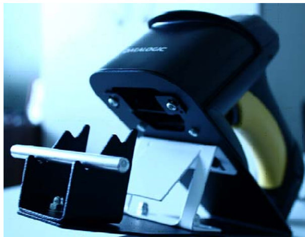
Устройство для чтения штрих-кода

Главной отличительной особенностью предлагаемого устройства является применение альтернативной схемы освещения.