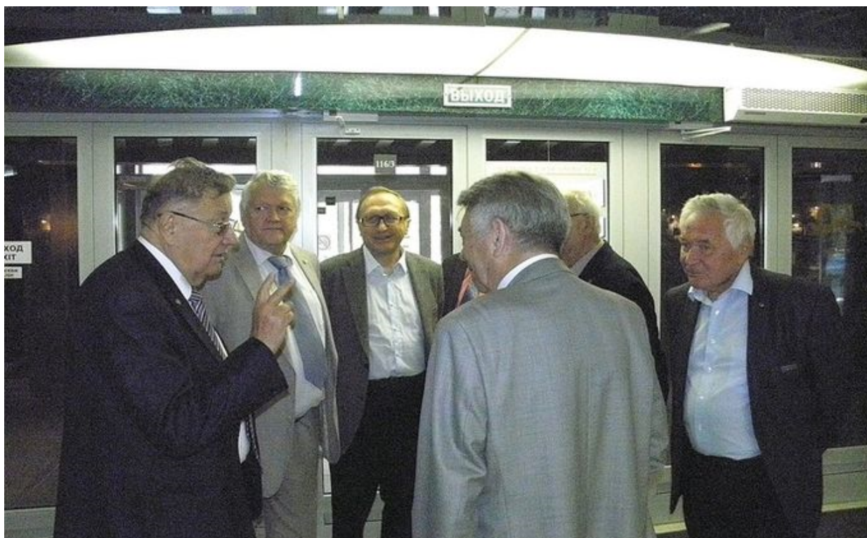
Научное сообщество пока гадает, кто же станет новым председателем Сибирского отделения.

Логачев были публично представлены действующим председателем СО РАН, свидетельствует: они являются основными претендентами на высокий пост.