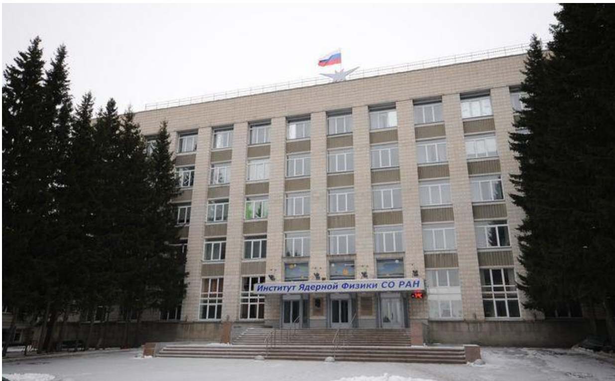
В 2015 году внебюджетные доходы Института ядерной физики составили почти 1,5 млрд рублей.