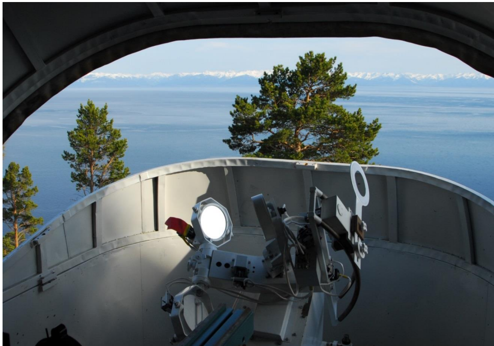
Двухканальная целостатная установка телескопа СТОП,

Телескоп СТОП предназначен для получения количественных данных о крупномасштабных магнитных полях (КМП) Солнца. По своим функциональным характеристикам это стоксметр - магнитограф, который используя эффект Зеемана, позволяет регистрировать распределение параметров Стокса в выбранном участке длин волн оптического диапазона для элементов фотосферы Солнца с заданными гелиографическими координатами. Измерения в магнито-чувствительных спектральных линиях и последующие вычисления позволяют получать количественную информацию о параметрах магнитного поля Солнца.