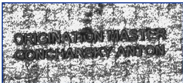
Увеличенный фрагмент голограммы. Размер шрифта микротекста 20 мкм.

Результат сканирования голограммы. В условных цветах показаны углы поворота элементарных дифракционных решеток, составляющих синтезированную голограмму, относительно выбранного направления на поверхности объекта.