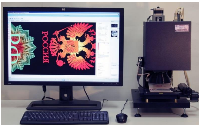
Внешний вид устройства

Оптико-электронное устройство предназначено для обнаружения, измерения параметров, экспертного (криминалистического) анализа подлинности и для автоматизированного контроля качества изготовления цифровых синтезированных защитных голограмм, выполненных на основе дифракционных оптических микроструктур без ограничения размера исследуемой голограммы.