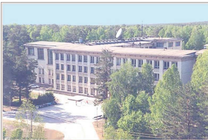
Новосибирский государственный университет

которых институтах достигает 40–45 %, в несколько раз увеличилось количество аспирантов.