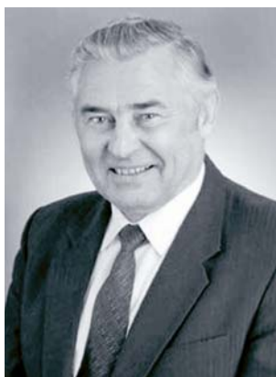
Г. И. Марчук