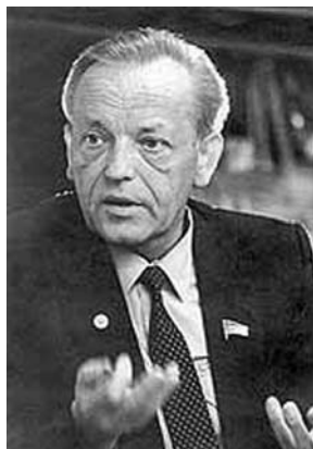
В. А. Коптюг