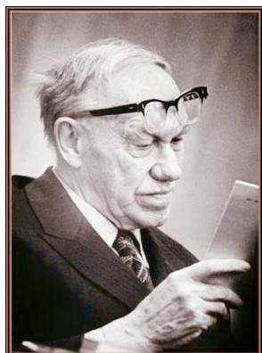
М. А. Лаврентьев

В состав Сибирского отделения были включены уже существовавшие научные учреждения Академии наук СССР, расположенные к востоку от Урала: Западно-Сибирский филиал (6 институтов), Восточно-Сибирский филиал в Иркутске (2 института), Якутский филиал (3 института), Дальневосточный филиал во Владивостоке, а также Сахалинский КНИИ и Институт физики АН СССР в Красноярске. Постановлениями Президиума АН СССР в течение 1957–1958 гг. были созданы новые институты: 14 в Новосибирске и 7 в Иркутске.