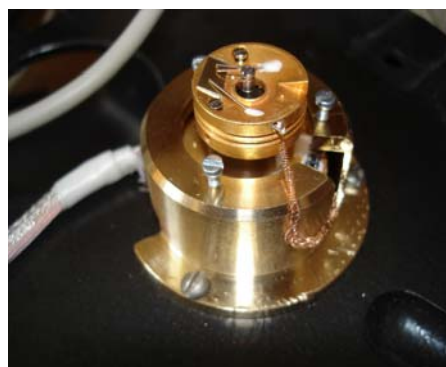
Рис. 2. Головка ТМ