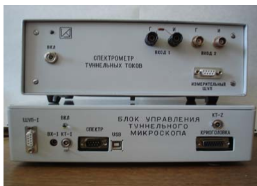
Рис. 1. Электронные блоки ТМ

В режиме спектрометрии энергетическое разрешение 0.002 эВ при чувствительности до 0.25 пкА по току.